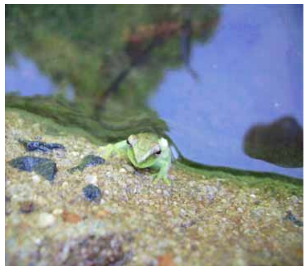
A perereca procurou um lugar seguro entre as pedras. Quando elas deixam de ser girinos já não querem mais ficar na água.