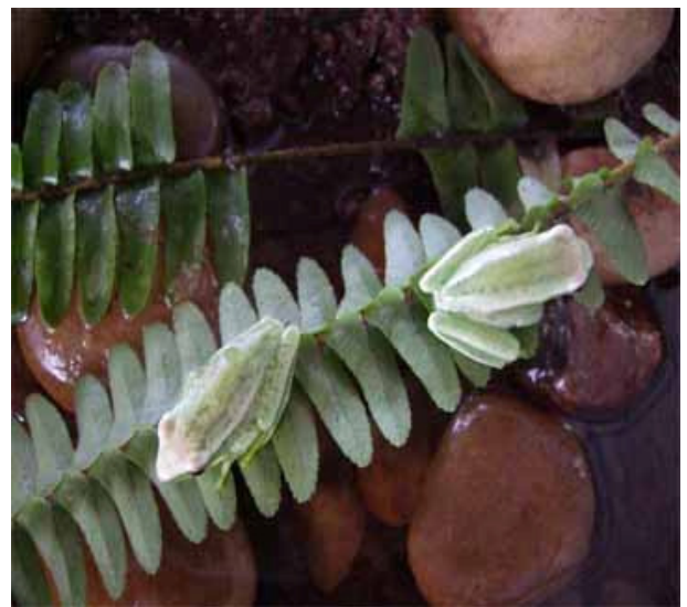
Grande surpresa! Entre os girinos encontramos dois que eram diferentes, bem maiores. Para nossa surpresa eram pererecas.