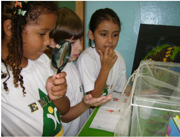
Crianças explicando sobre a metamorfose das borboletas