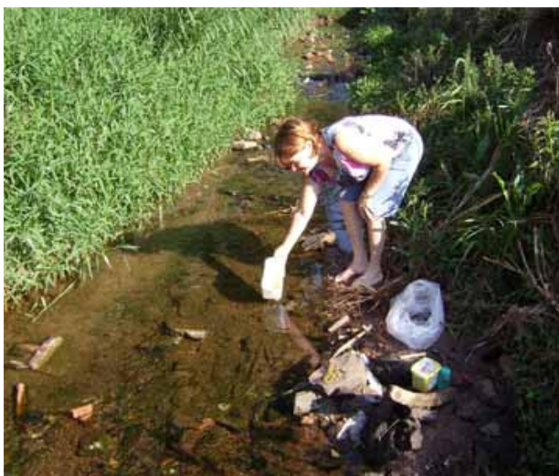
Os sapinhos depois de observados foram soltos, de volta em seu habitat natural