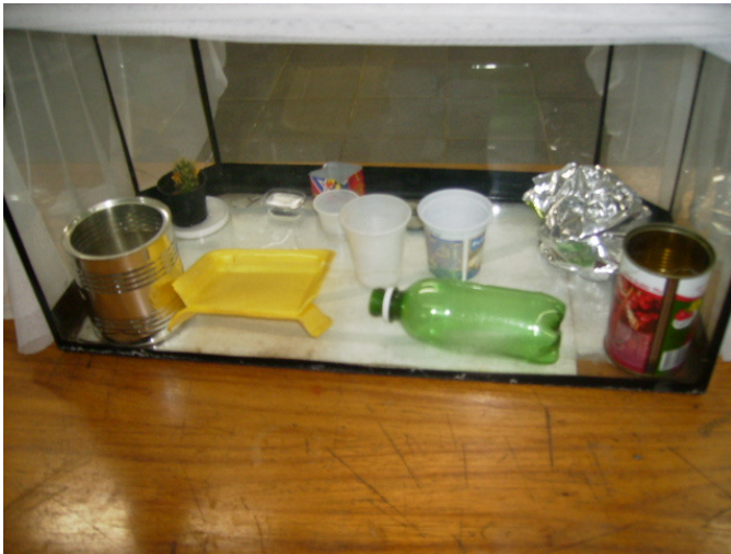
Possíveis criadouros do mosquito