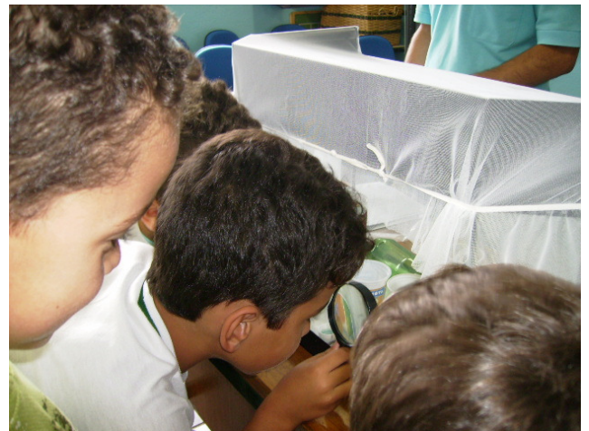
Alunos observando as larvas do mosquito

Larvas do mosquito e possíveis criadouros