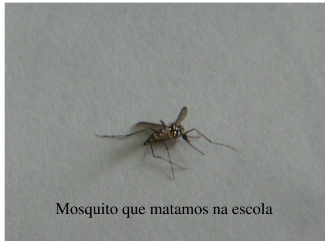
Mosquito que matamos na escola

Desenvolver um movimento de conscientização e ação (preventiva e educativa) sobre a dengue através da participação na II Gincana Escola Cidadã: Todos Contra a Dengue e do desenvolvimento de atividades diversificadas.